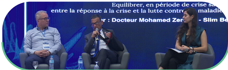
Equilibrer, en période de crise sanitaire, entre la réponse à la crise et la lutte contre les maladies infectieuses existantes.